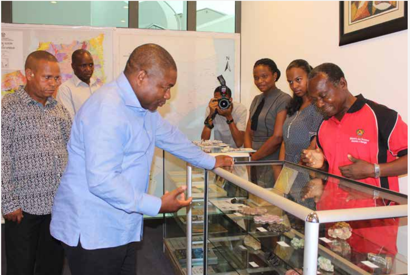
O Presidente da República interagindo com funcionários do MIREME

O sector dos Recursos Minerais e Energia possui grande potencial para alavancar a economia nacional, sobretudo nestas alturas em que se implantam diversas infra-estruturas para viabilizar a execução de alguns projectos estruturantes, exemplo de exploração de hidrocarbonetos na bacia do Rovuma, por companhias internacionais como a ENI e a Anadarko. A exploração do carvão mineral pelas multinacionais localizadas na bacia carbonífera de Tete também está a ganhar alento com a sub-