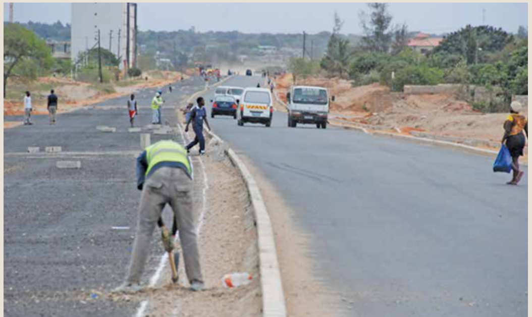
A concessão de estradas tem em vista garantir durabilidade

Aliás, referiu que o montante recebido este ano é inferior ao alocado em 2016, que esteve na ordem de 2,9 mil milhões