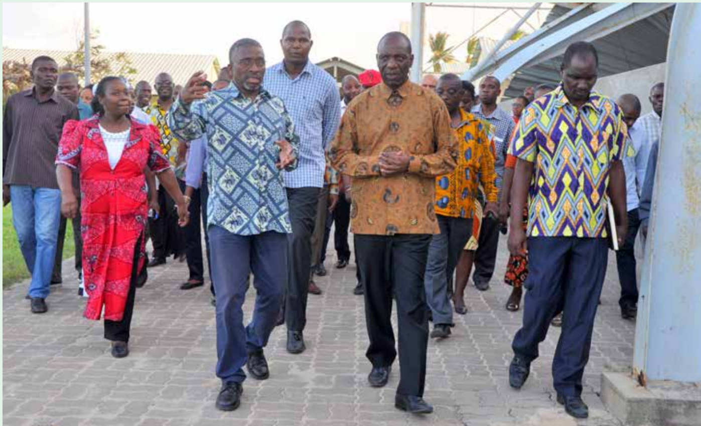
PM em visita Província de Inhambane

A província de Inhambane precisa de pouco mais de 1 bilião de meticais para se reerguer dos danos provocados pelo ciclone tropical Dineo, que abalou aquela parcela do país no dia 15 de Fevereiro.