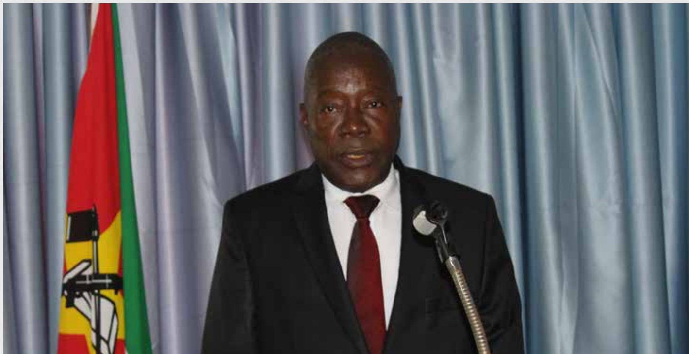
Lambo lançou as comemorações dos 50 anos da DF

O Destacamento Feminino assinala, no próximo dia 4 de Março, o 50.º aniversário da sua criação, um acto que vai ser marcado por diversas actividades culturais, políticas, desportivas e científicas em todo o país.